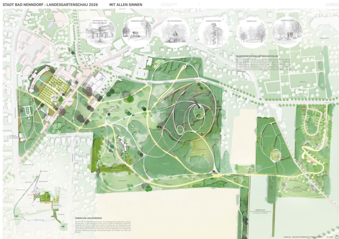
Abb. 3: Entwurf 2. Preis GRIEGER HARZER Landschaftsarchitekten – ohne Maßstab – ΔNord