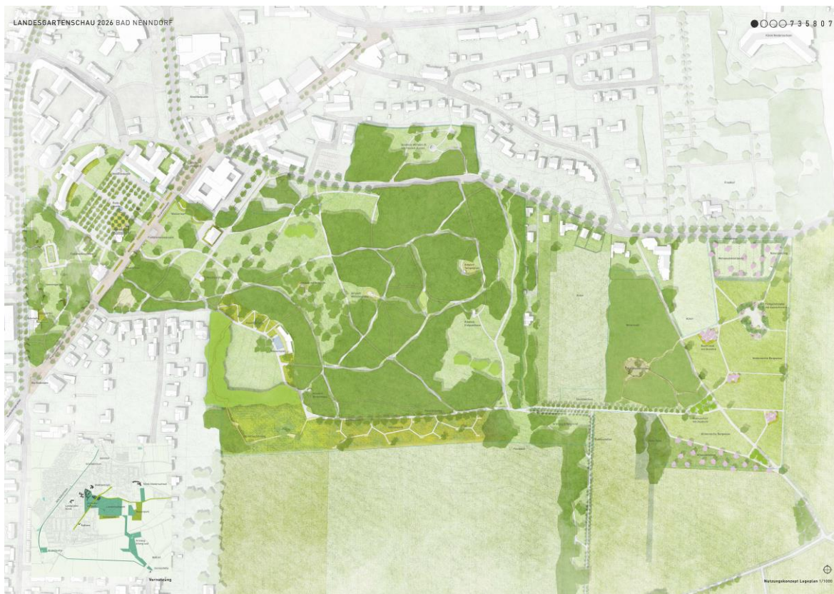
Abb. 4: Entwurf 3. Preis Lohaus Carl Köhlmos PartGmbH Landschaftsarchitekten Stadtplaner

hend sich selbst überlassen bleiben. Zur Begehbarkeit ist die Errichtung weniger schmale und flacher Stege geplant, die in einer kleinen Lichtung mit vorhandenen hochstämmigen Weiden enden sollen. Dort soll eine Waldhängematte mit einzelnen Hochsitzen die Möglichkeit zum Waldbaden garantieren.