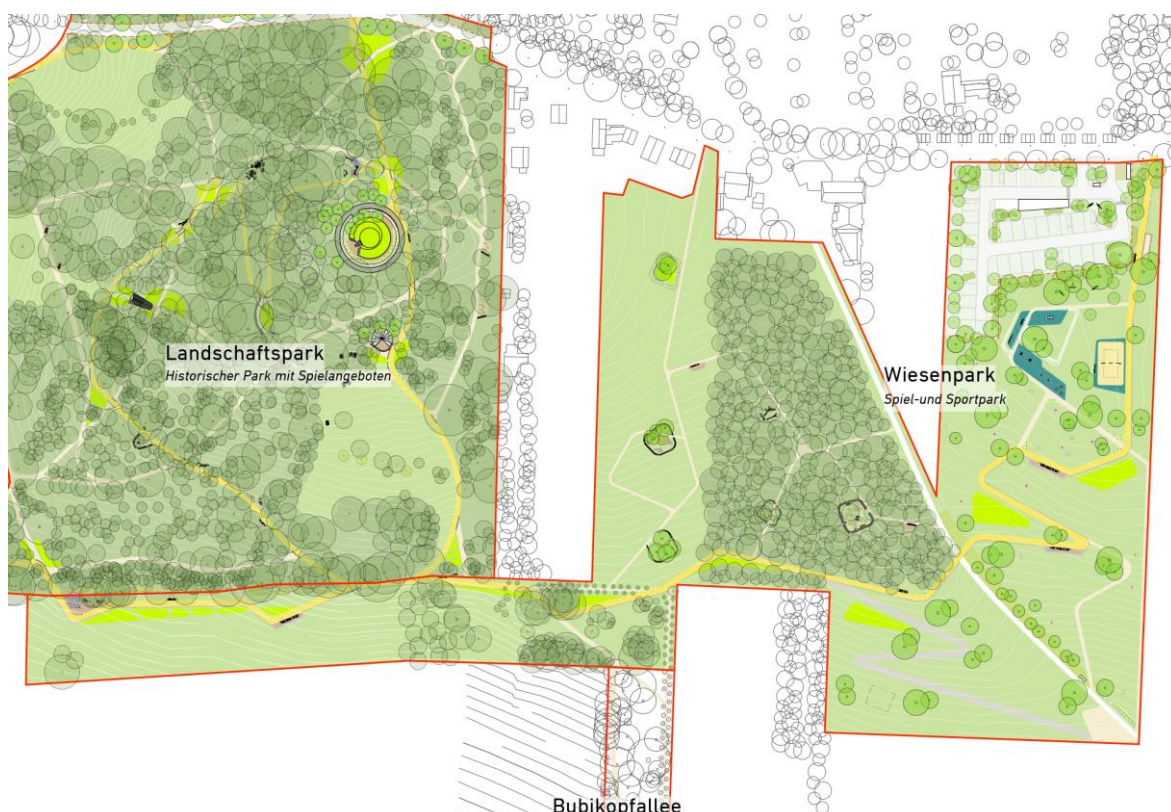
Abb. 6: Ausschnitt Lageplan „Wiesenpark“ - Entwurfsplanung