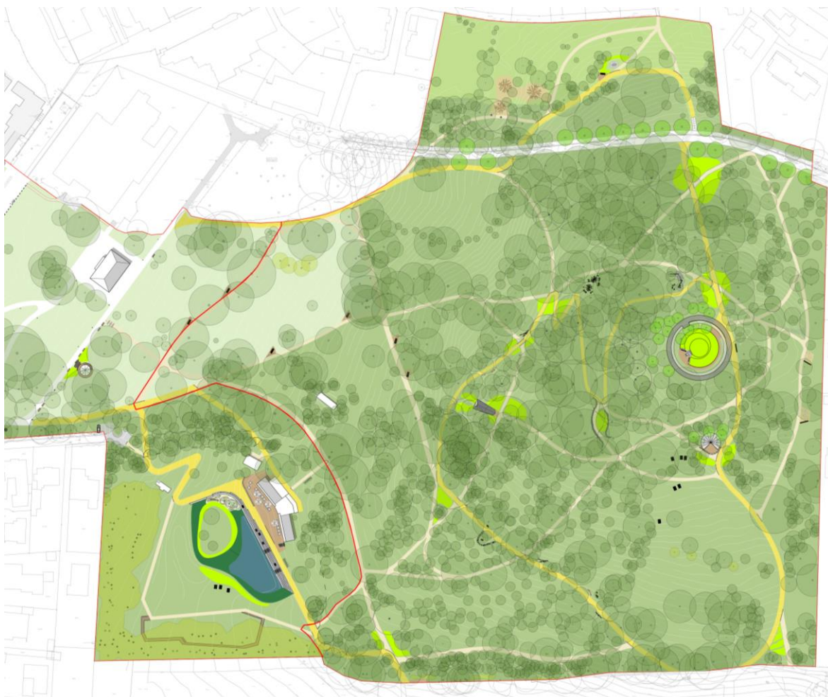
Abb. 5: Ausschnitt Lageplan „Kurpark/Landschaftspark“ - Entwurfsplanung