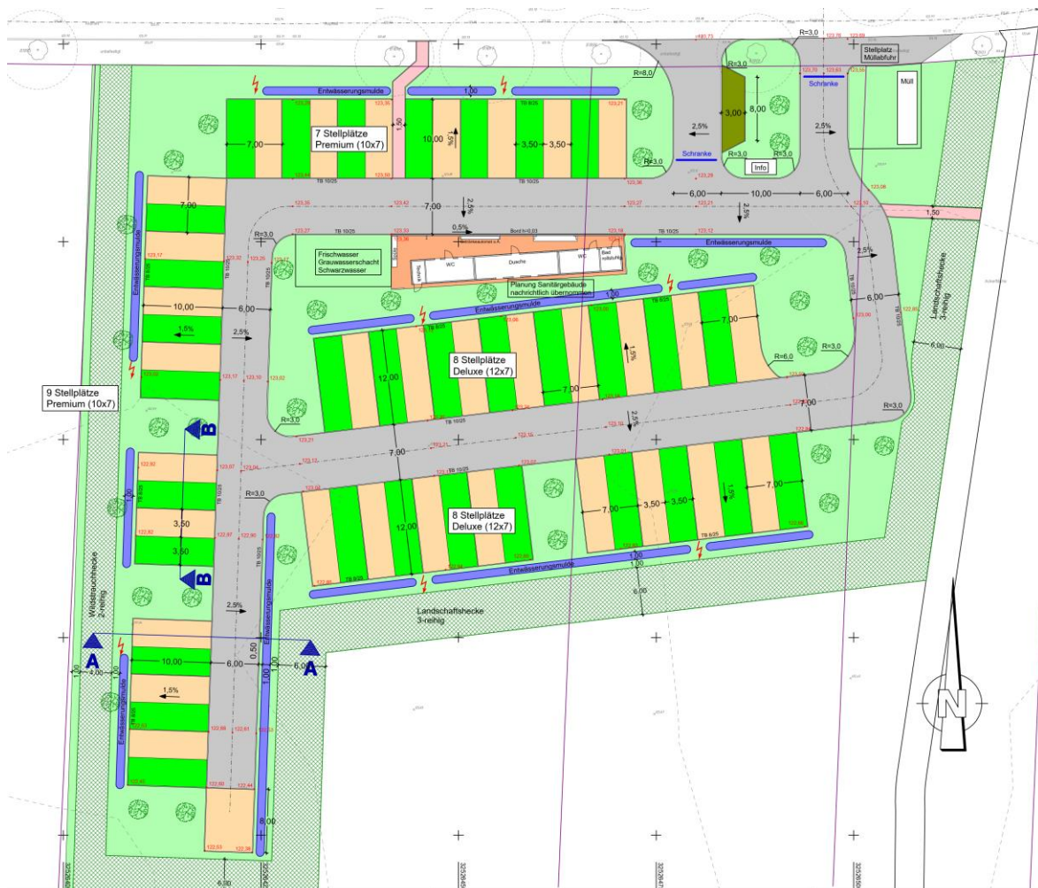
Abb. 7: Lageplan „Wohnmobilstellplatz“ - Entwurfsplanung – ohne Maßstab – ΔNord

Nördlich angrenzend an den Wiesenpark ist der Entwurf des Wohnmobilstellplatzes durch das Büro ZECH-CON Beratende Ingenieure GmbH weiter ausgearbeitet worden. Der Wohnmobilstellplatz wird über eine beschränkte Ein- und Ausfahrt von der Buchenallee aus erschlossen. Insgesamt soll der Wohnmobilstellplatz über 16 Premium Stellplätze (10,0 x 7,0 m) und 16 Deluxe Stellplätze (12,0 x 7,0 m) verfügen. Die Stellplätze sind zur Hälfte in einen Standplatz aus wassergebundenen Belägen und zur Hälfte aus einer Rasenfläche zum Aufenthalt geplant. Entlang der Standplätze verlaufen Entwässerungsmulden. In zentraler Lage ist auf dem Wohnmobilstellplatz die Errichtung eines Sanitärgebäudes geplant. Zur naturnahen Gestaltung sind eine Dachbegrünung für das Sanitärgebäude, die Anpflanzung verschiedener Sträucher und kleinerer Bäume sowie im Osten und Süden