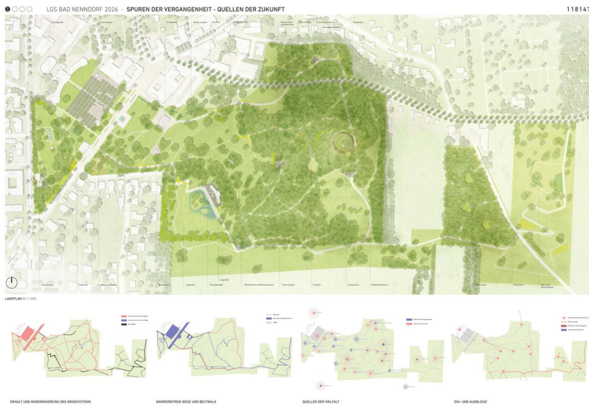
Abb. 2: Entwurf 1.Preis hutterreimann Landschaftsarchitektur GmbH

werden. Im Wiesenpark verteilt sollen darüber hinaus Klimabaumarten (Amberbaum, Schnurbaum, Gleditschien, etc.) gepflanzt werden. Der Wohnmobilstellplatz soll in einer lockeren Oberflächen-gestaltung mit minimaler Versiegelung sowie großzügiger Vegetation umgesetzt werden.