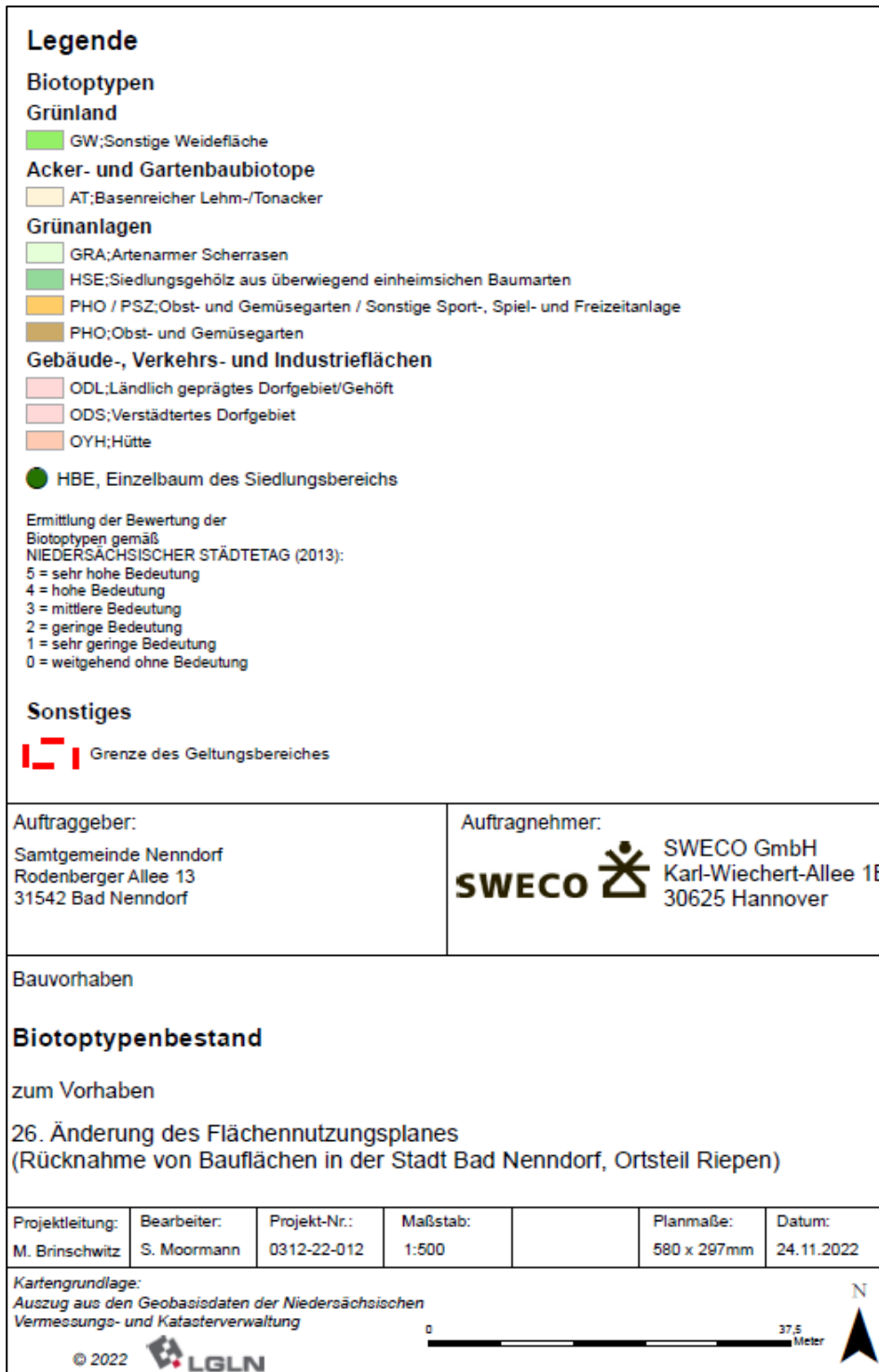
Abb. 7: Biotoptypenbestand - Legende (eigene Darstellung)