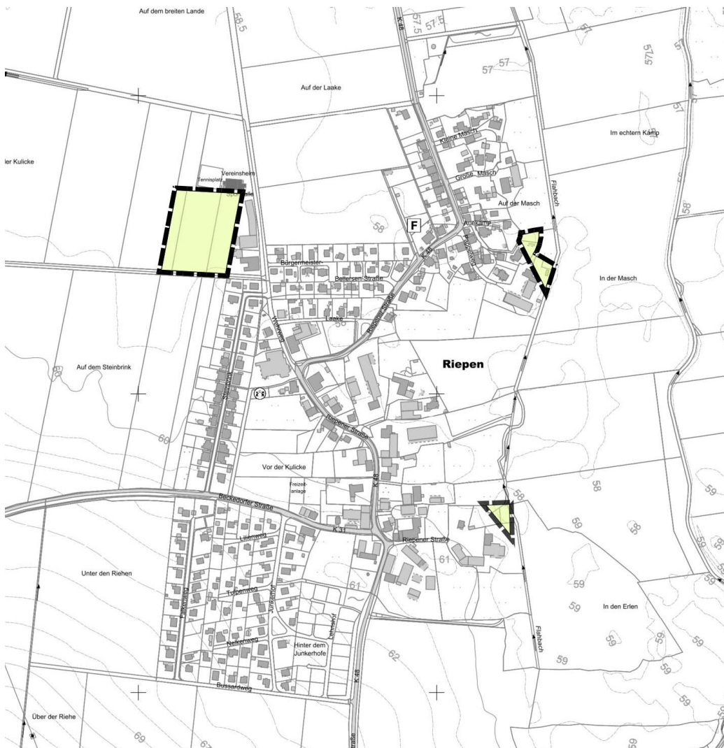
Abb. 2: Darstellung der Änderungsbereiche der 26. Änderung (unmaßstäbliche Darstellung, Karten- grundlage LGLN)

Hintergrund ist die vorgesehene Entwicklung innerhalb des Bebauungsplan Nr. 95 „Lehnshof“. Mit Blick auf die Möglichkeiten der Eigenentwicklung der Gemeinde stehen unter Berücksichtigung der Entwicklung des benannten Bebauungsplanes, in Abstimmung mit dem Landkreis Schaumburg, keine weiteren Entwicklungspotenziale für Riepen zur Verfügung. Daraus ableitend sind aus dem wirksamen Flächennutzungsplan Potenzialflächen herauszunehmen, um hier den geforderten Rahmenbedingungen des Landkreises bzw. den Zielen des RROP, unter Berücksichtigung der Eigenentwicklungsmöglichkeiten der Kommune. Mit dieser Änderungen werden diese Flächenpotenziale aus dem FNP herausgenommen.