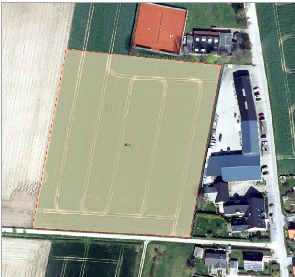
Abb. 4: Biotoptypenbestand Änderungsbereich 1 (eigene Darstellung)

Die Bewertung der Biotoptypen erfolgt gemäß der Arbeitshilfe zur Ermittlung von Ausgleichs- und Ersatzmaßnahmen in der Bauleitplanung vom NIEDERSÄCHSISCHEN STÄDTETAG (2013).