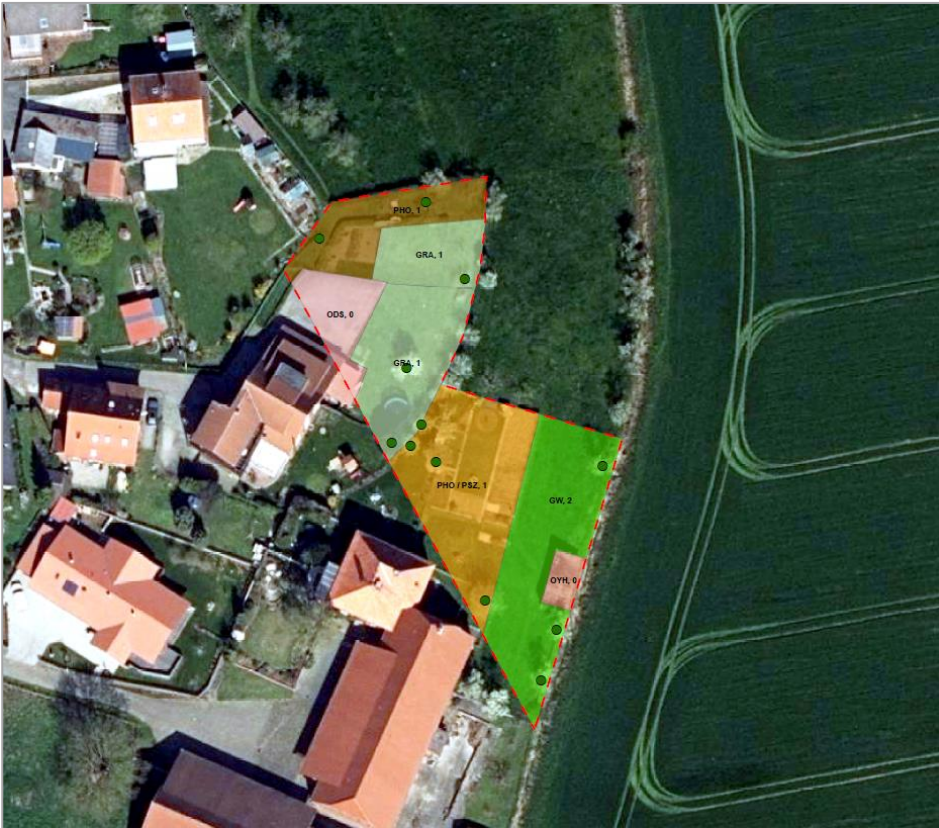
Abb. 5: Biotoptypenbestand Änderungsbereich 2 (eigene Darstellung)