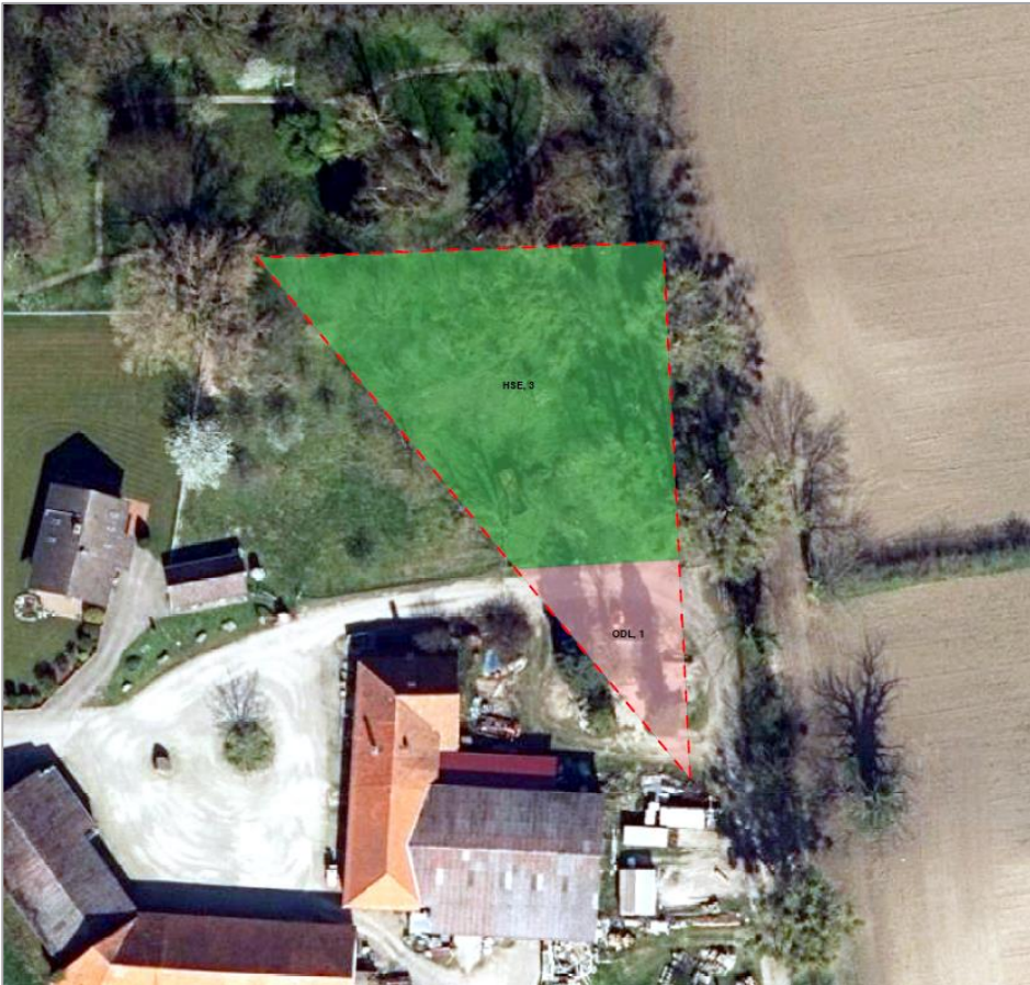
Abb. 6: Biotypenbestand Änderungsbereich 3 (eigene Darstellung)